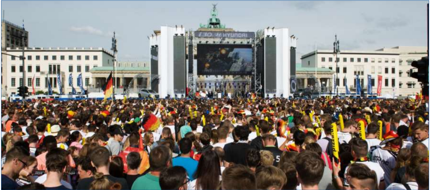
Werbespots bei Public Viewings