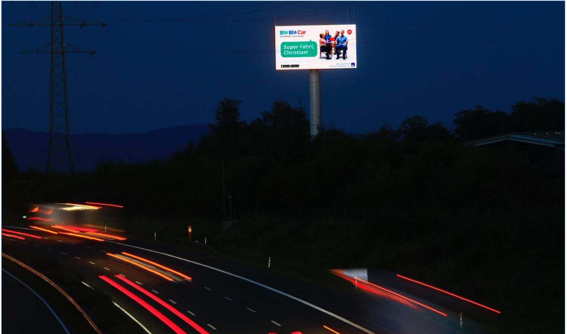
Werbung auf dem LED Anzeigenturm an der A3